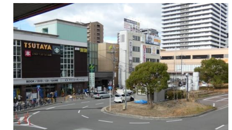
京阪本線 香里園駅