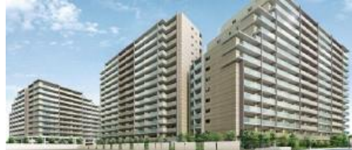
※外観イメージパース