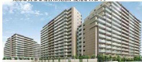
※外観イメージパース