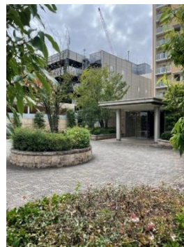
緑溢れるホテルライクな エントランス